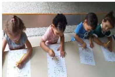
Coleta seletiva – Participação das famílias