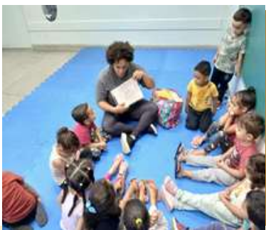
Contação de História – “Quem sou Eu” Intencionalidade: Demonstrar interesse ao ouvir histórias