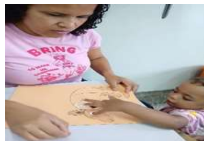
Confecção de livro com texturas (explorando suas diferenças)