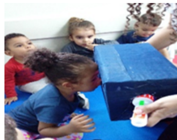
Confecção de caixa de luz e sombra