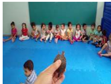
Visita da tartaruga - Amaro