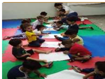
Desenho em Duplo