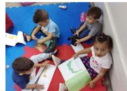
Trocas de livros

Sede: ALAMEDA DA CRIANÇA, 105 VILA VITÓRIA – (19) 3875-4598