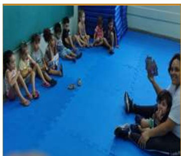
Conversa sobre os sentimentos