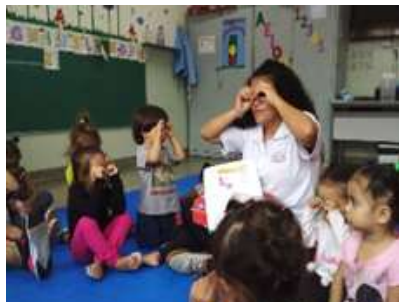
Caixa encantada com livros