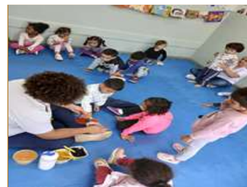
Fazendo tintas caseiras com terra, pó de café, beterraba, açafrão e urucum.