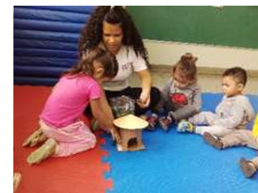
Cultura Indígena – Confeccionar uma Oca ( Explorando textura)

Sede: ALAMEDA DA CRIANÇA, 105 VILA VITÓRIA – (19) 3875-4598