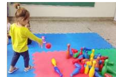
Brincadeira – Boliche Intencionalidade: Contagem de boliche

Sede: – ALAMEDA DA CRINÇA, 105 – VILA VITÓRIA (19) 3875-4598