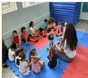
Jogo da imitação