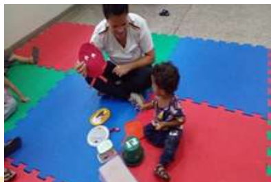
Explorar objetos com forma de Circulo