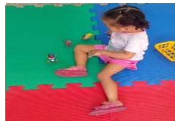
Brincadeira de Faz de conta com animais