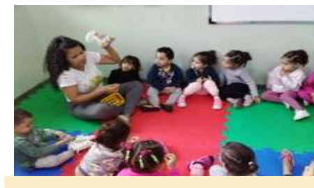
Musicalização – Dona Aranha Confecção das luvas com tampinha