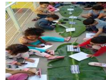
Desenho em grafismo em folhas com carvão