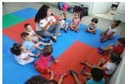
Criando histórias em Quadrinho.