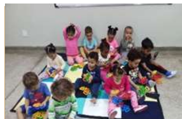
Brincando com peças de montar em formato de trevo