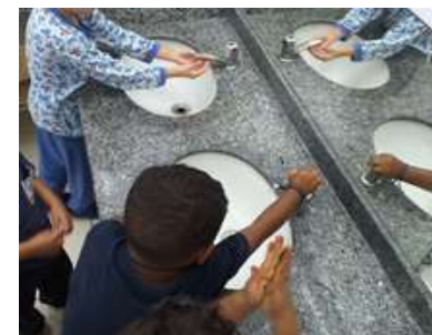
Cuidado com o corpo / Higiene e Cooperação