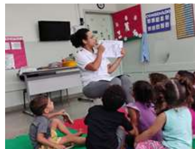
Leitura do livro Cauã o Índigena