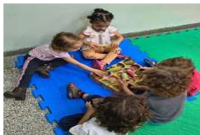
Brincadeira de encaixar o rolinho de papel na caixa