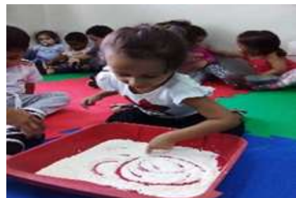
Desenho na farinha de Trigo